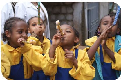
ワンホープガーデンで学ぶ生徒達